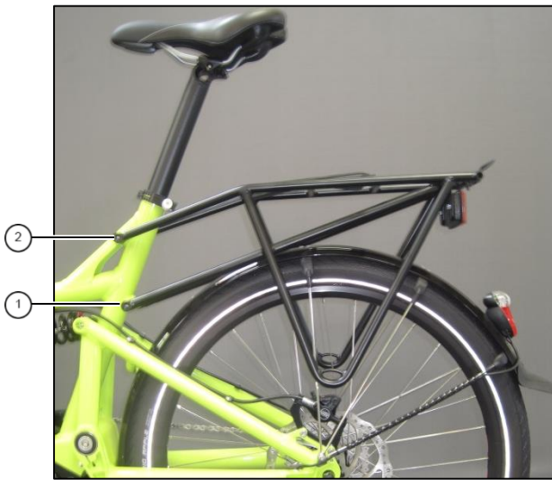
Fig. 1: mounted carrier