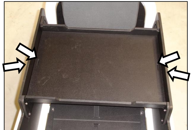
fig. 2: luggage rack